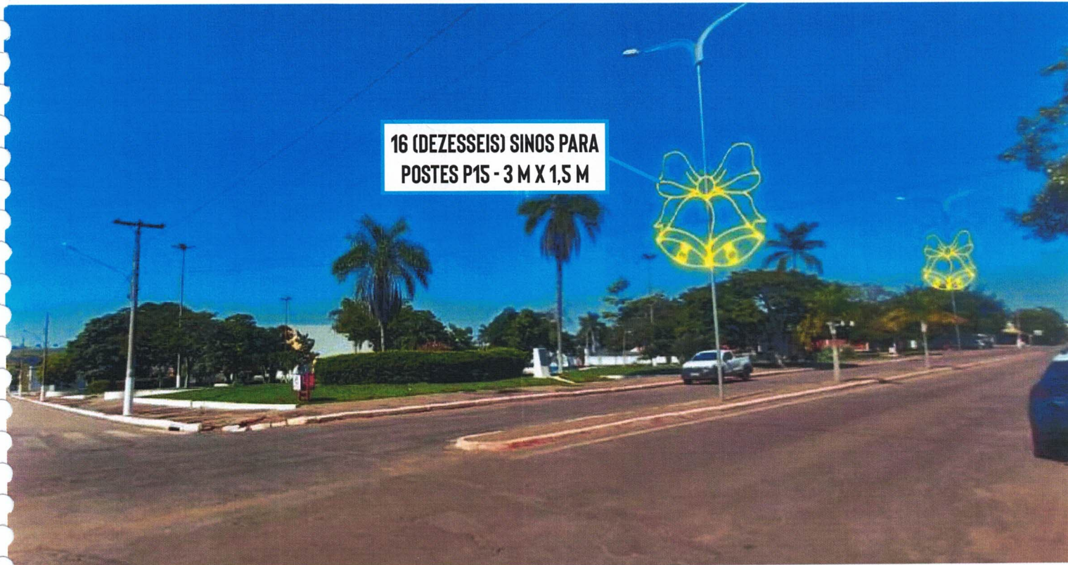
16 (DEZESSEIS) SINOS PARA POSTES P15 - 3 M X 1,5 M