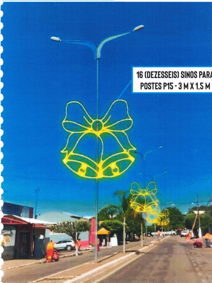
16 (DEZESSEIS) SINOS PARA POSTES P15 - 3 M X 1,5 M