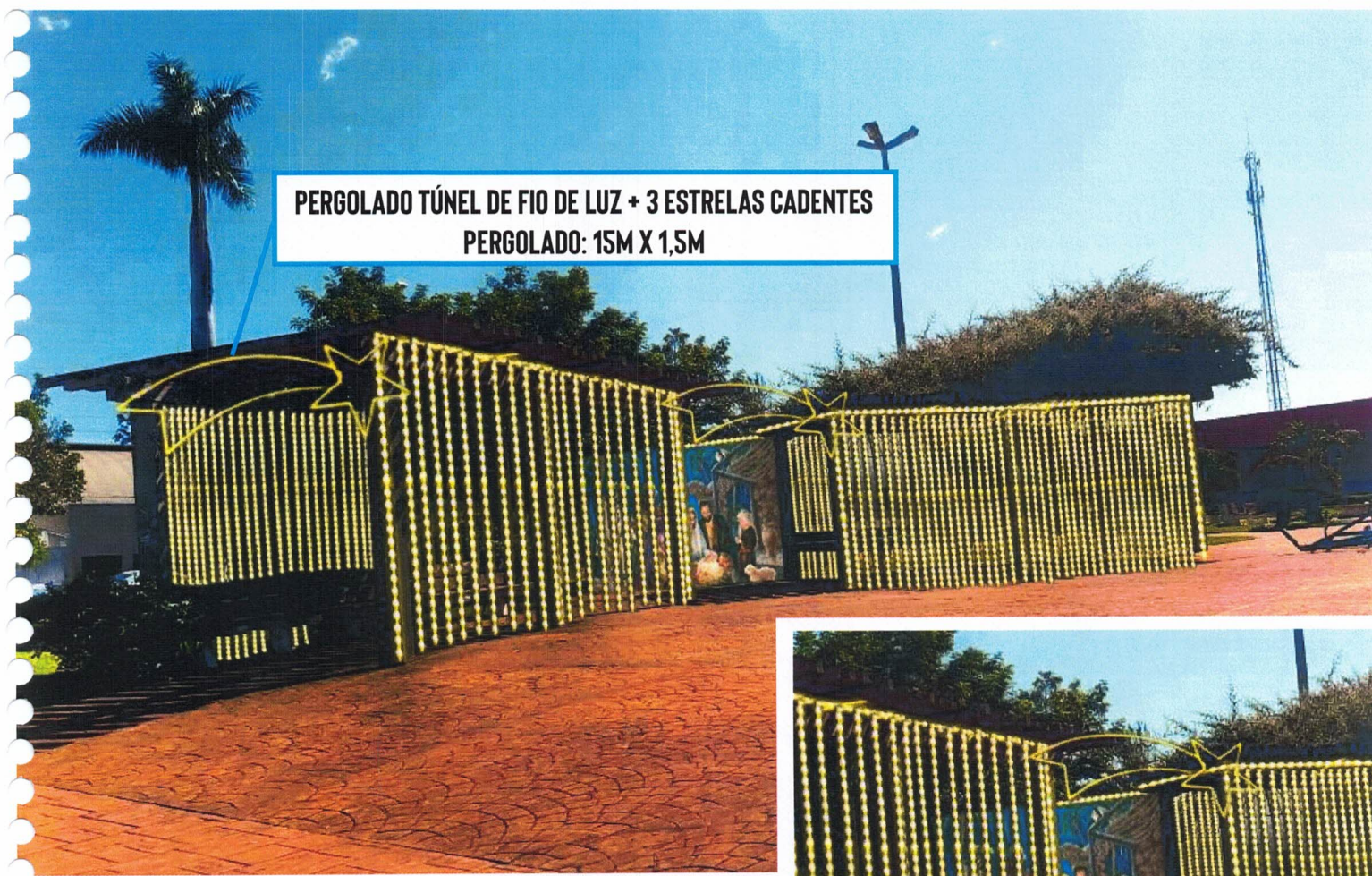
PERGOLADO TÚNEL DE FIO DE LUZ + 3 ESTRELAS CADENTES PERGOLADO: 15M X 1,5M