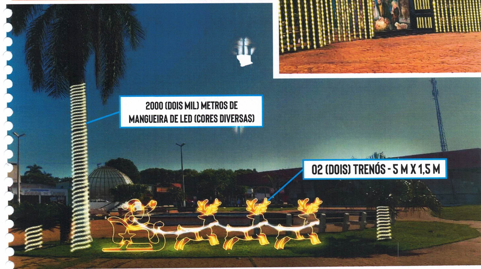
2000 (DOIS MIL) METROS DE MANGUEIRA DE LED (CORES DIVERSAS)